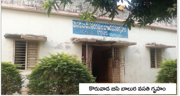
కొరువాడ బసి బాలర వసతి గృహం

ప్రజాశక్తి-అనకాపల్లి ప్రతినిధి : పేద పిల్లలు చదువుతున్న వసతి గృహాల్లో కనీస సదుపాయాలు ప్రభుత్వం కల్పించడంలేదు. చలికాలంలో తలుపులు, కిటికీలు సరిగాలేక చలిగాలులకు నిద్రపోని రాత్రులు విద్యార్థులు గడుపుతున్నారు. ప్రభుత్వ భవనాలు సహా ప్రయివేటు అడ్డ భవనాల్లో ఈ సమస్య ఎంతోకాలంగా వెంటాడుతున్నా ఎవరికీ పట్టడంలేదు. వసతి గృహాల సమస్యలను అధికారుల దృష్టికి తీసుకెళ్లిన వార్తాపత్రంకు బడ్జెట్ లేదని సమాధానం చెబుతున్నారు. పంపిన ప్రతిపాదనలకు దిక్కుమొక్కులేదు.