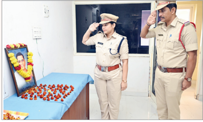
అనకాపల్లిలో నివాళి అర్పిస్తున్న డిఎస్పి