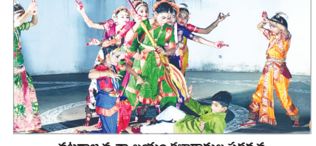
నటరాజ నృత్యాలయం కళాకారుల ప్రదర్శన

ప్రజాశక్తి - మధురవాడ : శిల్పారామం జాతరలో వారంతపు సాంస్కృతిక కార్యక్రమాల్లో భాగంగా ఆదివారం నిర్వహించిన శాస్త్రీయ, జానపద నృత్యప్రదర్శనలు ప్రేక్షకులను అలరించాయి. విశాఖపట్నం నటరాజ నృత్యాలయం కళాకారుల నృత్యప్రదర్శన ప్రేక్షకులను రంజింపజేసింది. ముందుగా బ్రహ్మంజలి, మరకతమయ తరంగం, భాషా కలాపం, బుల గలల తరంగం వంటి కీర్తనలకు హానిని, మోక్షిత, గున్వాక్, చిన్నయ, సౌజన్య గామిని, సాధ్య, యస్మిత్ నక్షత్ర, లిఖిత, దీపిక, నీత్రశ్రీ లయబద్ధంగా చేసిన నృత్య ప్రదర్శన ప్రేక్షకులను కట్టిపడేశాయి. కార్యక్రమాన్ని శిల్పారామం పరిపాలన అధికారి టి. విశ్వనాథరెడ్డి పర్యవేక్షించారు