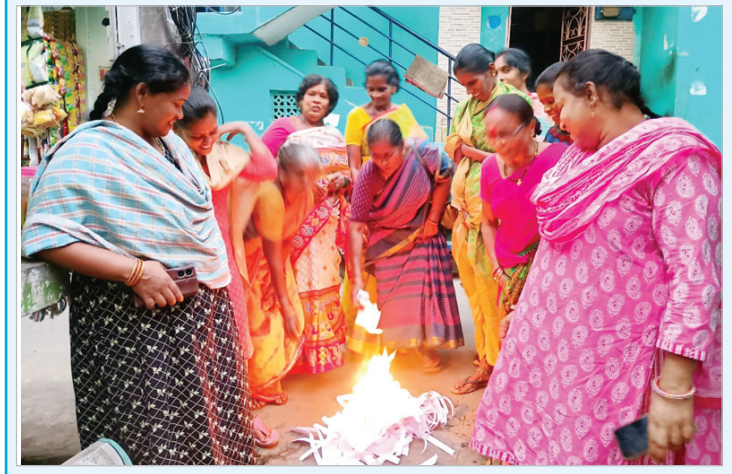
సిజిఎం కంచరపాలెం జోన్ కమిటీ ఆధ్వర్యం విద్యుత్ బిల్లులను దహనం చేస్తున్న మహిళలు