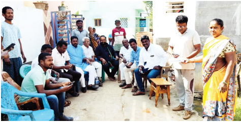
సభ్యత్వ సమేతు చేస్తున్న టిడిపి నాయకులు