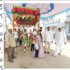
ఊరేగిస్తున్న ముస్లిం సోదరులు

ప్రజాశక్తి - నక్కవల్లి: మండలంలోని పెదబోడుగల్లం లో ముస్లిం సోదరులు ఆదివారం ఘనంగా ఖాదర్ వల్లి ఉర్సు పండగ జరుపుకున్నారు. ముస్లిం సోదరులు బావులాలను గుర్రంపై గ్రామంలో ఊరేగించారు. దర్గాలో, మసీదులో ప్రత్యేక ప్రార్థనలు చేశారు. గ్రామంలో పండుగ వాతావరణం నెలకొంది. ఊరేగిస్తున్న ముస్లిం సోదరులు