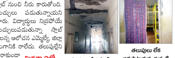
తలుపులు లేక అడ్డుపెట్టుకున్న దుప్పటి