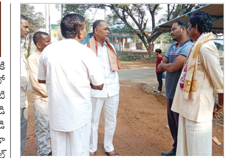
సమస్యలు తెలుసుకుంటున్న ఎమ్మెల్యే రాజు

ఇచ్చిందన్నారు. గడబపాలెం గ్రామంలో 20 కుటుంబాలకి 148/16,71,72,120 సర్వే నెంబర్ 1988-89 ఏడాదిలో ప్రభుత్వం డి పట్టా భూములు ఇచ్చిందని చెప్పారు. అప్పటి నుంచి తమ సాగులో ఉందని పేర్కొన్నారు. శ్రమించి జీడి మామిడి తోటలు పెంచి భూములపై ఆధారపడి జీవిస్తున్నామన్నారు తమ పేర్లు 22వ జూలైలో కూడా ఉన్నాయని గత ఏడాదిలో జరిగిన జగనన్న రిసర్వేలో డి ఎల్ ఆర్ రికార్డులలో తమ భూముల్ని ప్రభుత్వం భూములుగా నమోదు చేశారని తెలిపారు. ఈ ఏడాదిలోనే ఎస్టీ కమిషన్ చైర్మన్ ఫిర్యాదు చేయగా ఈ సమస్యను పరిష్కరించాలని జిల్లా కలెక్టర్ కు ఆడిశాలు జారీ చేశారని వివరించారు. ఈ సమస్యను పరిష్కారం చేయాలని ఆడిశించారని దీనిపై మండల రెవిన్యూ అధికారులు రామన్నదొరపాలెం, గడప పాలెం గ్రామాలలో క్షేత్రస్థాయిలో పరిశీలించి చర్యలు చేపట్టాల్సి ఉన్నప్పటికీ అది దిశగా చర్యలు లేవని ఆందోళన వ్యక్తం చేశారు. తక్షణమే తమ భూములు తమ పేరున రెవెన్యూ రికార్డులలో నమోదు చేయాలని డిమాండ్ చేశారు.