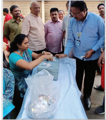
చిల్లర నాణేలు పంపిణీ చేస్తున్న కనక మహాలక్ష్మి కో-ఆపరేటివ్ బ్యాంక్ అధికారులు, సిబ్బంది