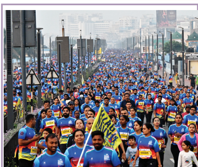
మారథాన్లో పాల్గొన్న విశాఖ వాసులు