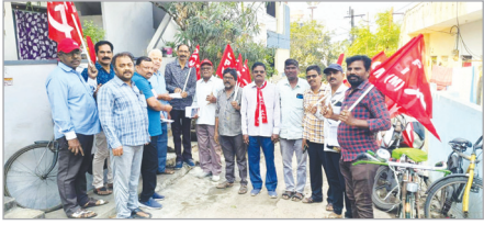
విద్యుచ్ఛవానిపాలెంలో ప్రచారం చేస్తున్న సిపిఎం నేతలు