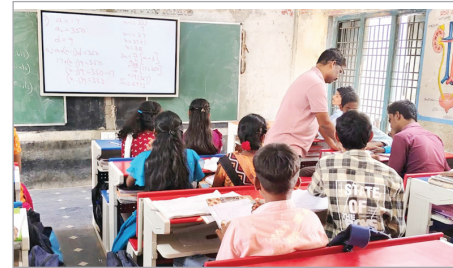
బోధన చేస్తున్న ఉపాధ్యాయులు