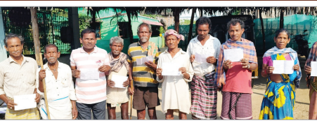
నిరసన చేపడుతున్న ఆదివాసీలు