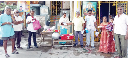
కరవత్త ప్రచారం చేస్తున్న పౌరు సంక్షేమ సంఘం నాయకులు

ప్రజాశక్తి-అనకాపల్లి ప్రజలపై భారాలు పెంచే స్టార్ట్ మీటర్లను బిగించవద్దని, వినియోగదారులపై వేసే అదనపు ట్రూ ఆఫ్ చార్జీలను, ఎఫ్ఎఫ్ చార్జీలను రద్దు చేయాలని పౌర సంక్షేమ సంఘం నాయకులు డిమాండ్ చేశారు. ఈ మేరకు సంఘం నాయకులు ఆదివారం ఇంటింటికి కరవత్తలను పంపిణీ చేశారు. గవర్నమెంట్ సంతోష్ మాత గుడి ప్రాంతంలో పెద్ద