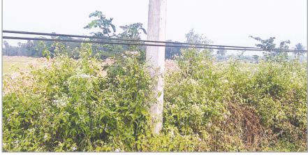
అనంతవరం రైనుమిల్లి సమీపంలో ఉన్న కేబుల్ వైర్లు

ప్రజాశక్తి -పద్మాభం: మండలంలోని అనంతవరం గ్రామానికి వెళ్ళిన ఆరిఅండ్ బి రోడ్డుపై వేలాడుతున్న కేబుల్ వైర్లు వాహనదారులకు ప్రాణాంతకంగా మారుతున్నాయని ఆందోళన చెందుతున్నారు. ఈ మార్గంలో వెళ్ళే బస్సులు, లారీలు, ఆటోలు, బైక్లు ఇతర వాహనాలతోపాటు పాదచారులు ప్రయాణించే సమయంలో విద్యుత్ సందాహిత కేబుల్ వైర్లు ఊడిపోయి వేలాడుతుండడంతో అవి తగులుతుండడంతో ఎటువంటి ప్రమాదం జరుగుతుందోనని ఆందోళన చెందుతున్నారు. దగ్గరకు వచ్చేంత వరకు వేలాడుతున్న వైర్లు కనబడని పరిస్థితి ఉండడంతో వేగంగా ప్రయాణించినా, లేకుంటే ఎమాత్రం ఆదమరిచినా ఆయా వైర్లు తగిలి ప్రమాదాల బారిన పడుతున్నారు. దీనిపై సంబంధిత అధికారులు చొరవచూపి తగు చర్యలు చేపట్టాలని కోరుతున్నారు.