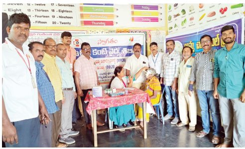
కంటి పరీక్షలు చేస్తున్న దృశ్యం