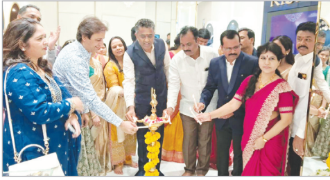
కిన్నా డైమండ్ అండ్ గోల్డ్ జ్యువెలరీని ప్రారంభిస్తున్న ప్రతినిధులు