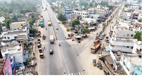
డ్రోన్ ద్వారా ఫాటో తీసిన తాళ్ల పాలెం జంక్షన్