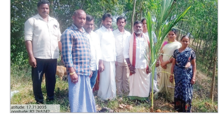
కొబ్బరి మొక్కను నాటుతున్న సర్పంచ్