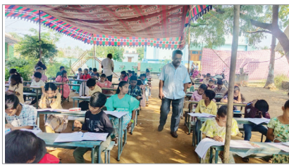
పరీక్షలు రాస్తున్న విద్యార్థులు