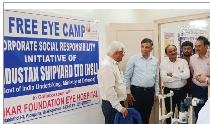
ఉచిత నేత్ర వైద్య శిబిరం ప్రారంభంలో అతిథులు