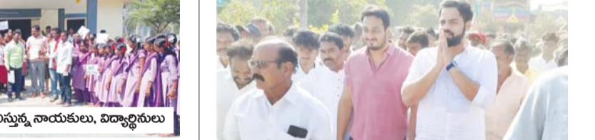
ఎన్ఎఫ్ఐ వినతి పత్రం అందిస్తున్న నాయకులు, విద్యార్థిని

దాదాపుగా 50 సంవత్సరాల నుండి చుట్టూ కాంపౌండ్ వాల్ లేదని, విద్యార్థులు ఇబ్బందులు పడుతున్నారని చెప్పారు. పాఠశాలలో ఎవరు వదిలే వాళ్ళు రావడం, రాత్రి సమయంలో అసాధికార కార్యక్రమాలు అక్కడే జరుగుతున్నాయని అధికారులకు ఎన్నోసార్లు ఫిర్యాదులు చేసినా ఎ ఒక్కరూ స్పందించడం లేదన్నారు. చుట్టూ కాంపౌండ్ వాల్ లేనందువలన స్కూల్ ఆవరణం చుట్టూ షాపులు కేటాయిం మహిళా విద్యార్థులకు భద్రత లేకుండా భయభ్రాంతులకు గురి