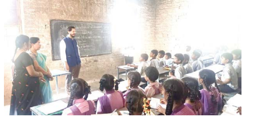
ఎన్డీఎస్ పరిక్షలకు సన్నద్ధం చేయాలి