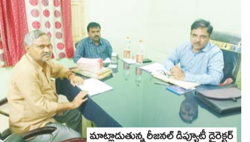
మాట్లాడుతున్న రిజిస్ట్రార్ డిప్యూటీ డైరెక్టర్